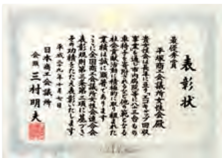
最優秀(日本商工会議所会頭賞)賞状

を回収し、平塚市へ車椅子を合計83台寄贈した活動が評価されたものとなります。 今後も、当会では各種事業活動を通じて地域に貢献していく所存ですので、皆様のご協力をお願いします。