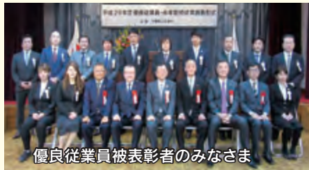
優良従業員被表彰者のみなさま