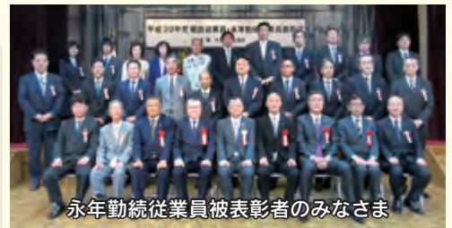
永年勤続従業員被表彰者のみなさま