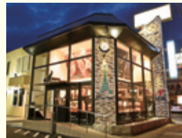
シャンパン☆ベーカリー

この表彰は神奈川県と県商工会議所連合会、県商工会連合会の共催で1976年から実施されているもの。毎年、県内の中小小売業、飲食店の中から真心尽くしたサービスや味や技など個性ある店舗を表彰しており、今年度は34店舗が受賞した。