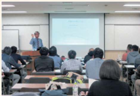
熱心に聞き入る参加者

「ネットショップの進展によって、消費者の小売店離れが進んでいる。ネットショップとの棲み分けに対応するためには、リアル店舗の特徴を見直すべき。これからのお店には、一つの方向性としてお客様の衝動買いを誘発する店作りが求められる。そこで、お店の原点である「おすすめ」を積極的に行うこと＝一店逸品運動は不可欠。」参加者は、逸品運動による魅力ある個店づくりからの集客UP、売上UPへの逸品成功事例を含めた内容の講演を熱心に聞き入っていました。