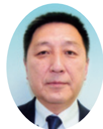
議員 豊田正紀氏 三菱ケミカル株式会社 平塚事業所 所長