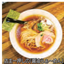
店主一押しの「醤油らぁ〜めん」

平塚駅前に来られた際にはぜひ「麺処 まるよし」のこだわりのラーメンをご賞味ください。