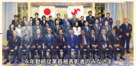
永年勤続従業員被表彰者のみなさま