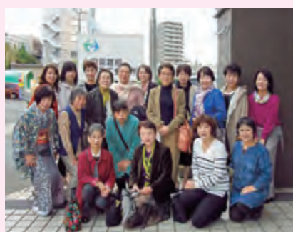
総務委員会 【担当】経営支援課22-2511

のひと時でした。その後「鈴廣かまぼこの里」にてかまぼこ・ちくわ手づくり体験をし、お土産を手に、ゆったりした研修会で少し参考にしてみたい街でした。