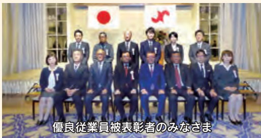
優良従業員被表彰者のみなさま