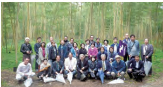
若山農場若竹の杜にて

大谷資料館の地下採掘場跡は、約70年をかけて大谷石を掘り出してできた地下30mに広がる巨大な地下空間です。戦時中は地下の秘密工場として、戦後は政府米の貯蔵庫として利用されていました。実際、中に入るとまるで地下神殿のようで、参加者の方々は美しい光景に魅了されていました。