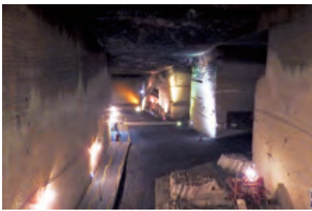
大谷資料館地下採掘場跡

洞窟内は年間温度が平均10℃と清酒の熟成には最適な温度であり、季節により±5℃の温度差が瓶内で対流を生じさせ、常に品質が均一化された状態で熟成されます。そうして出来上がった洞