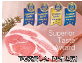
ITQI受賞した「やまと豚」

これからも商工会議所を通じて地域活動に積極的に参加し、地域に貢献できるよう取り組んでいきたいと思っておりますので、今後ともよろしくお願い致します。