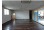
(中小企業防災・減災投資促進税制のイメージ)