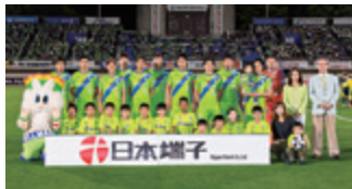
湘南ベルマーレ オフィシャルクラブパートナー