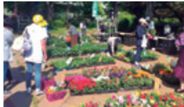
植木市・花市 ※写真は花市