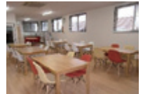
休憩室や食堂等の整備に係る建物附属設備等が対象に