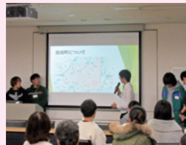
東海大学生による発表

「商店街活性化へ向けた地域・大学連携を考える」メインテーマは「平塚市中心街の活性化について」