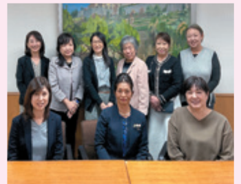
東横INN湘南平塚駅北口 | 富田寿弓会員

「飾らず、自分らしく、いつでも明るい講師の人柄が素敵です」「東横INN平塚に泊まりたいと思います」