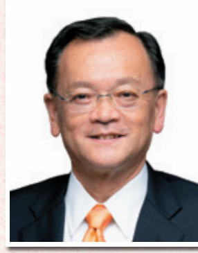
平塚市長 落合 克宏

皆さまの御理解と御協力をお願い申し上げます。 さらなる労働力不足の深刻化や社会保障制度の維持困難などが課題となる「2040年問題」など、令和7年10月に実施された国勢調査の結果も踏まえ、今後、本市の状況を共有し、将来に向けた議論を重ねてまいります。議会としても、議会機能の向上と自己研鑽に取り組み、さらに市民に親しまれる議会になるよう引き続き努めてまいります。 結びに、平塚商工会議所の益々の御発展と、会員の皆さまの御活躍と御多幸をお祈り申し上げまして、新年の御挨拶とさせていただきます。