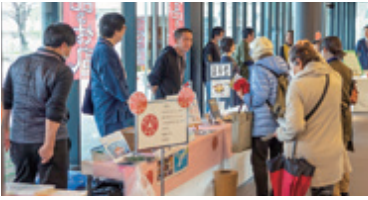
逸品おひろめ会の様子(2024年2月)

ご自身の商売についてお悩みの方、商品・サービスのPR方法やお店のポップについて学びたい方、他店に負けない売りを見つけたい方、自分のお店にしかない商品・サービスを追求・創造したい方...是非多くのメンバーと共に有意義な時間を過ごしてみませんか？詳しくは、今月号に同封してあります。