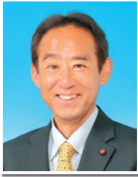
平塚市議会議長 板間正昭