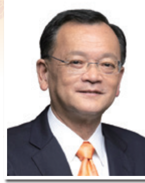
平塚市長 落合克宏

めに積極的な取組みが重要であり、商工業の発展も重要と考えています。そこで、議員の日々の活動を通して、市民の皆様の声に耳を傾け、より生産性の高い効果的な政策を提言するため、議員一同自己啓発に取組み、議会機能の充実と市民に親しみやすい議会になるよう、引き続き努めてまいります。同時に、積極的な取組みのためには、地域の経済動向や企業の実情に精通された商工会議所の皆様の協力なくしては十分な立案は望みません。今後とも御理解と御協力をいただきますようお願い申し上げます。 結びに、平塚商工会議所の更なる発展と、会員の皆様の御繁栄並びに御多幸を心からお祈り申し上げます。新年の御挨拶とさせていただきます。