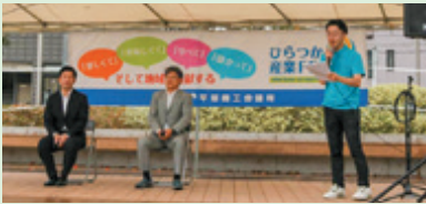
「100年記念パネلディスカッション」の様子

今回のようなビジネスマッチングイベントを平塚YEGで開催することは初めての試みであり、交流・研鑽・渉外活動を通じ、ビジネスリー