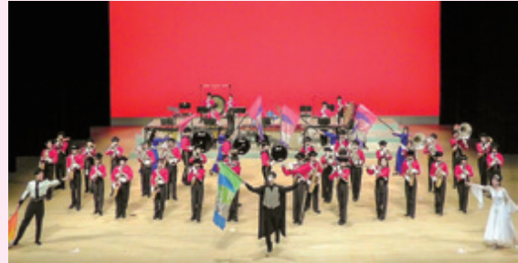
“THE PHANTOM OF THE OPERA”

ステージ上では、昨年2月に引き続き、東海大学吹奏楽研究会による圧巻のパフォーマンスが繰り広げられました。重厚なクラシック曲から始まり、塔の上のラパンツェル、JPOPのメドレーと続き、「ダンシン