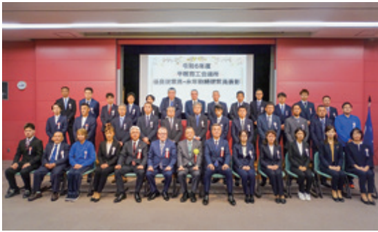
優良従業員・永年勤続従業員 被表彰者のみなさま

今年度は優良従業員表彰に7名、永年勤続従業員表彰に37名、計44名の方が受賞されました。