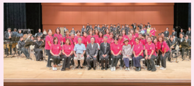
本年もありがとうございました！