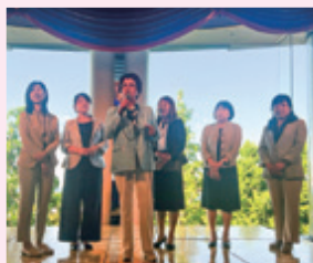
嘉山公子顧問による活動報告会場が沸きました！