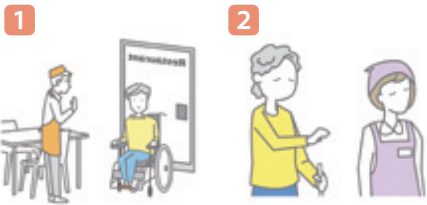
1 保護者や介助者がいなければ一律に入店を断る 2 障害があることを理由として、障害のある人に対して一律に接遇の質を下げる