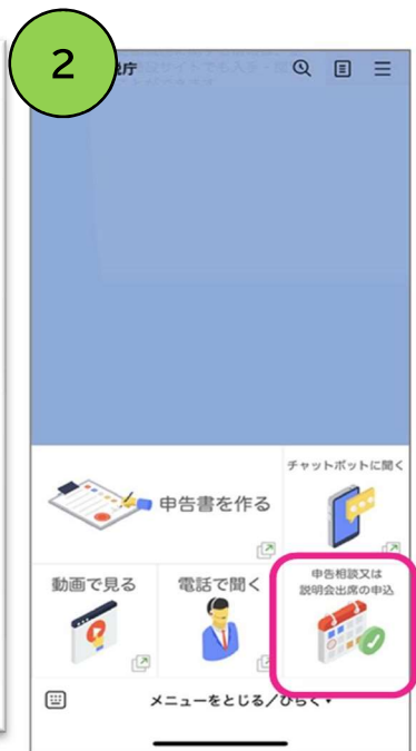
説明会の申込を選択