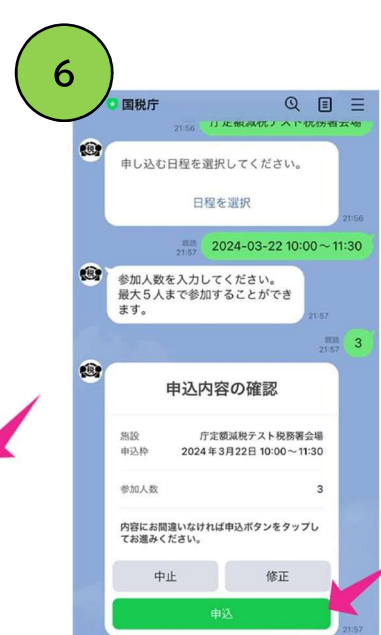
「申込」をタップして完了