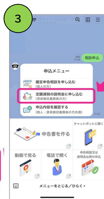
定額減税の説明会选择