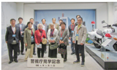
東 京 都 中 央 卸 売 市 場 豊 洲 市 場 警 視 庁 本 部 を 三 団 体 合 同 に よ り 視 察 研 修 会 を 実 施 し た。

この日は晴天にも恵まれ、参加者は、昼食時においても参加者同士の情報交換や懇親もすることができ、有意義な視察研修会になった。