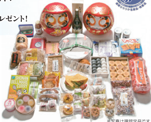
※写真は現認定品です

投票期間 ：10月17日(月)～11月14日(月)まで 投票方法 ：QRコードへアクセスし専用サイトより投票 投票数 ：1人1回まで・名産品にしたい商品を3品選ぶ 投票対象 ：投票時点で平塚市内に在住、または市内の会社や学校に在勤・在学の方 投票特典 ：抽選でひらつかスターライトマネーポイントをプレゼント！