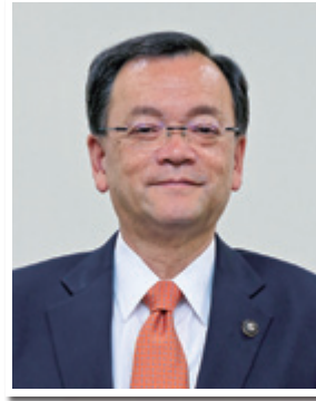
平塚市長 落合 克宏

あけましておめでとーございませう。平塚商工会議所の皆さまには、健やかに新春をお迎えのこととお喜び申し上げます。