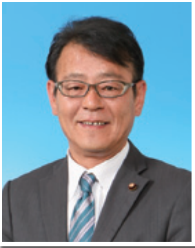
平塚市議会議長 片倉 章博