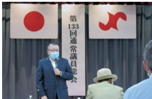
第133回通常議員総会